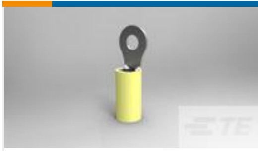
TE 产品编号2-320568-2 TERM, RT, PIDG IR, 12, #8