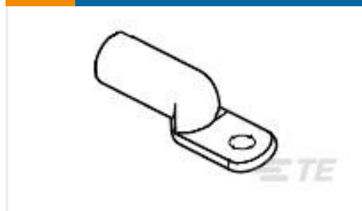
TE 产品编号277150-2 TERMINAL,COPALUM R 2 5/16