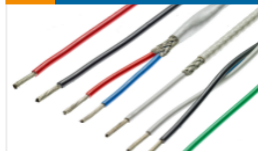
TE 产品编号CZ2009-000 CTC-0057-24-9/5-9-L080