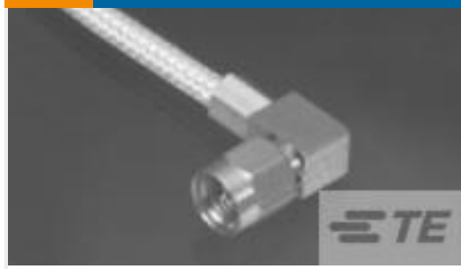
TE 产品编号1052098-1 2037 5100 02