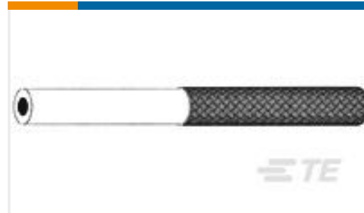
TE 产品编号D209003001 RAY-103-7.5(100)