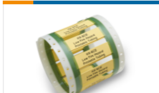
TE 产品编号F29905-000 HX-SCE Low Fire Hazard Sleeves