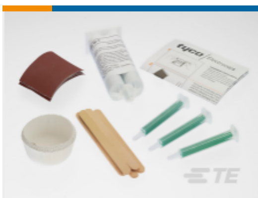
TE 产品编号 657863-000 S1125-KIT-8