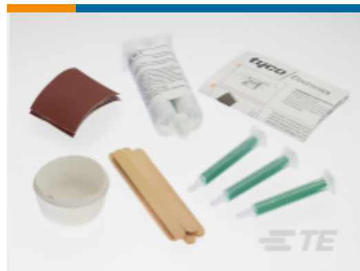
TE 产品编号 657863-000 S1125-KIT-8