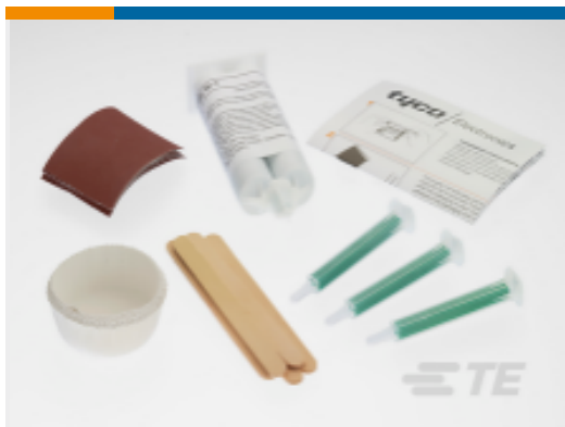
TE 产品编号 657863-000 S1125-KIT-8