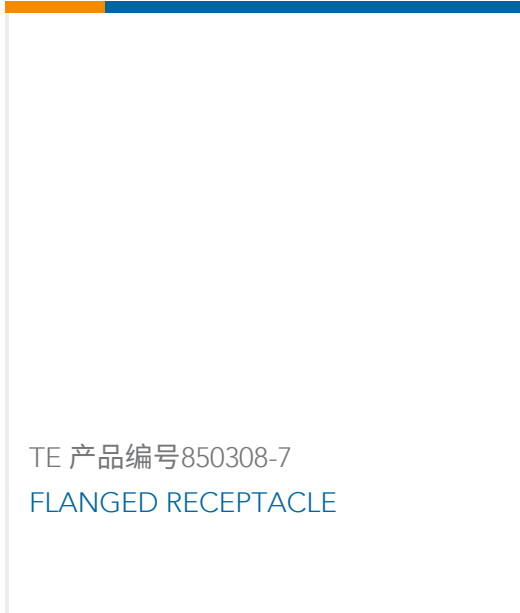
TE 产品编号850308-7 FLANGED RECEPTACLE