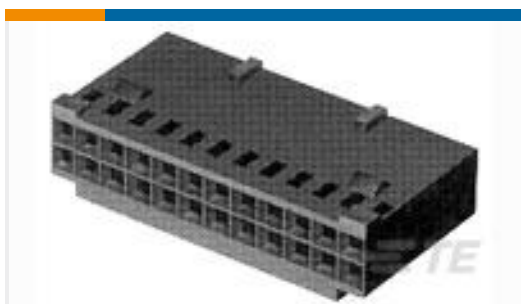
TE 产品编号4-87631-2 50 MODIV HSG DR MRKD .100 POL