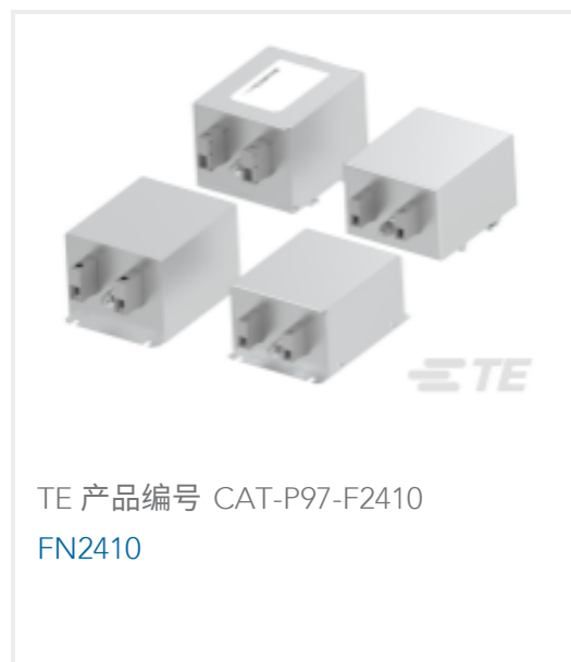
TE 产品编号 CAT-P97-F2410 FN2410