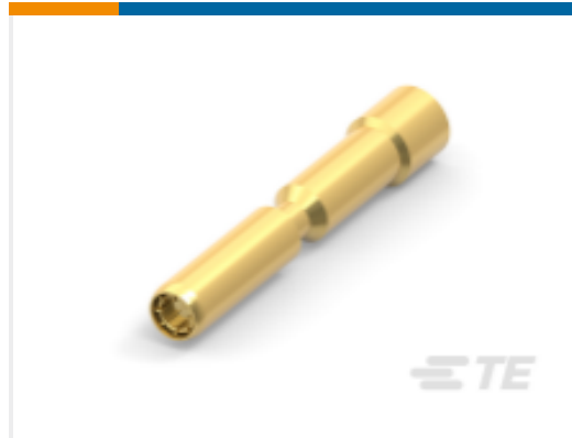
TE 产品编号60-0001-011-000 CONTACT SOCKET 1 MM