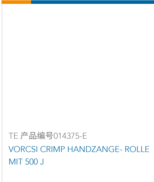
TE 产品编号014375-E VORCSI CRIMP HANDZANGE- ROLLE MIT 500 J