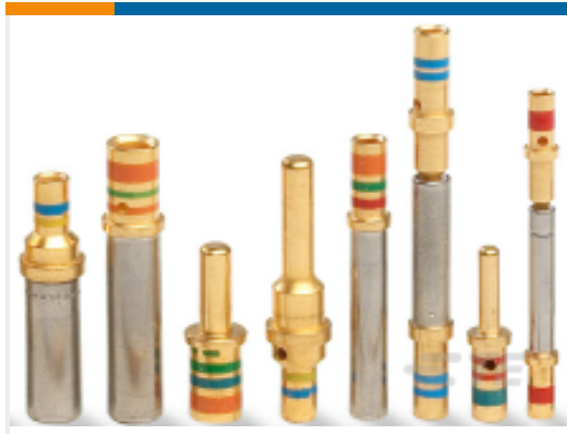
TE 产品编号0641-2-1631L CONT PIN