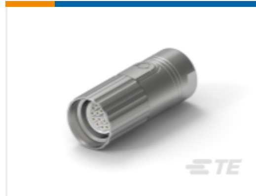
TE 产品编号ASA876N0085200A000 617 PLUG