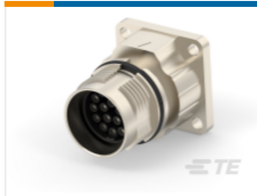
TE 产品编号AEA874N0000150A000 617 RECEPTACLE, SPEEDTEC-READY