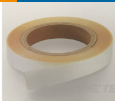
TE 产品编号 890060-000 S1017-1.0X50