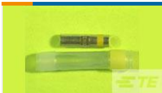
TE 产品编号 650075-000 D-436-37