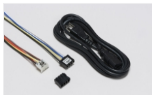
EMI 和 EMC 附件(2)