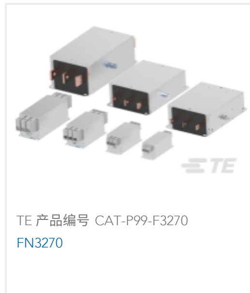
TE 产品编号 CAT-P99-F3270 FN3270