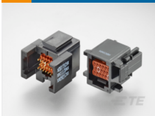
TE 产品编号ABC06N-22P IN-LINE PLUG