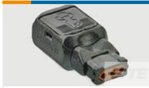
TE 产品编号D369-P33-NS1 369 3 WAY PLUG, CRIMP, SKT