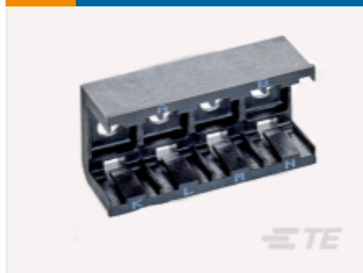
TE 产品编号DCR-1A-06 COMPOSIT RAIL