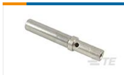
TE 产品编号0462-201-16141 SOC, SOLID, SIZE 16, 16-20AWG, NI