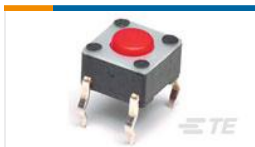
TE 产品编号1-1825910-4 FSM8JH=6MM TACT SWITCH, HIGH TEMP