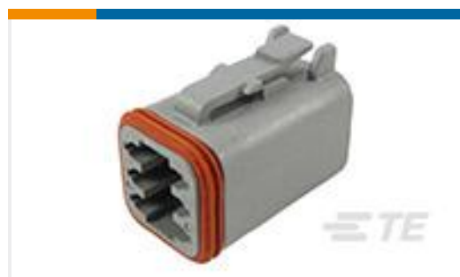
TE 产品编号DT06-6S-C015 PLG, 6P, GRY, E