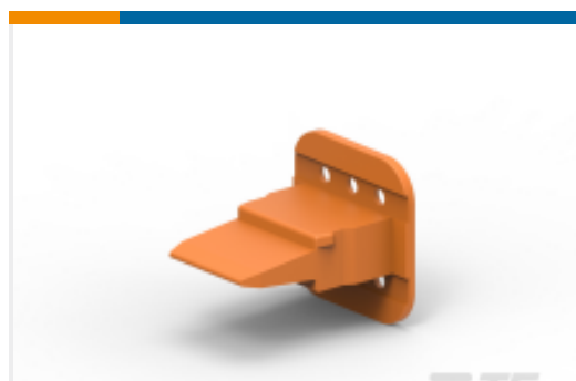
TE 产品编号W6S WEDGE LOCK, 6P, PLG, ORG, STD, DT