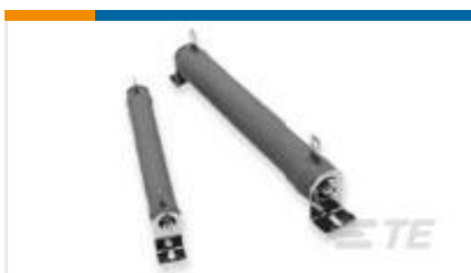
TE 产品编号2-1879453-1 TE 1000W 47R 5% Bracket