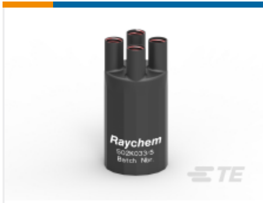
TE 产品编号E00553N001 502K033/S(S15)