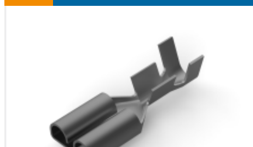
TE 产品编号170031-5 .250 FASTIN ON