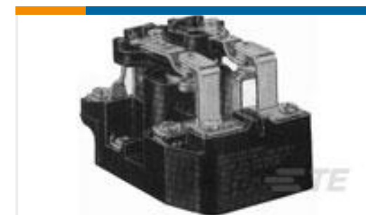
TE 产品编号1-1393127-6 PRD-11AH0-120=PRD