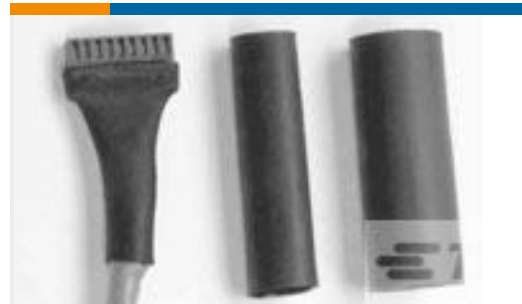
TE 产品编号7580142002 DWP-125-3/8-0-STK