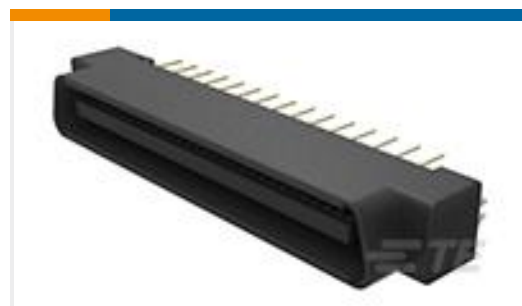
TE 产品编号1734100-4 Champ050 series,40pos,Au over PdNi