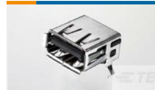
TE 产品编号292303-6 Std USB Type A, R/A, T/H