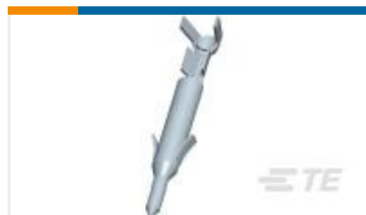
TE 产品编号170359-3 MINI UNIVERSAL M-N-L PIN