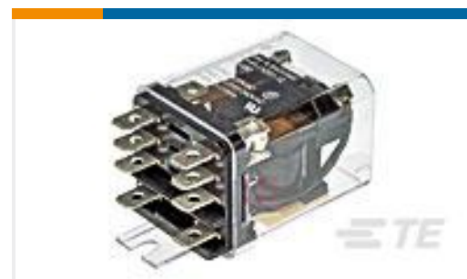
TE 产品编号6-1393114-5 KUHP-11AT1-120=KU