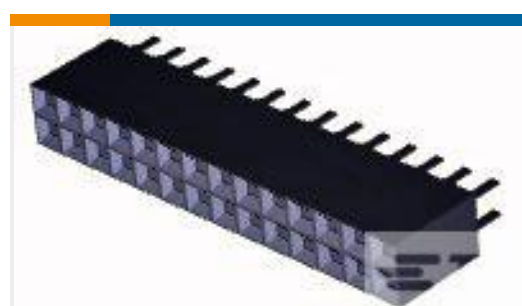
TE 产品编号6-534206-4 28 MODII VRT DR CE 100/115