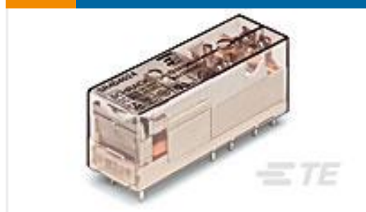
TE 产品编号3-1415055-1 SR4D4024