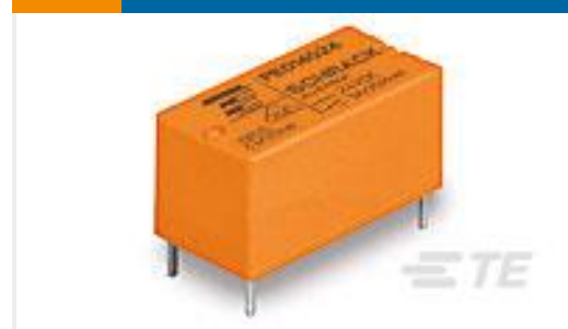
TE 产品编号1393219-8 PE014018