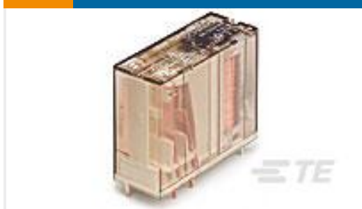
TE 产品编号1-1393258-7 V23047-A1024-A511