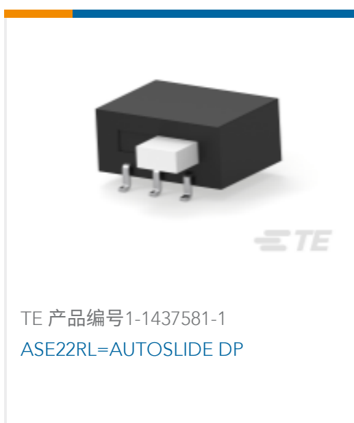
TE 产品编号1-1437581-1 ASE22RL=AUTOSLIDE DP 0.3W