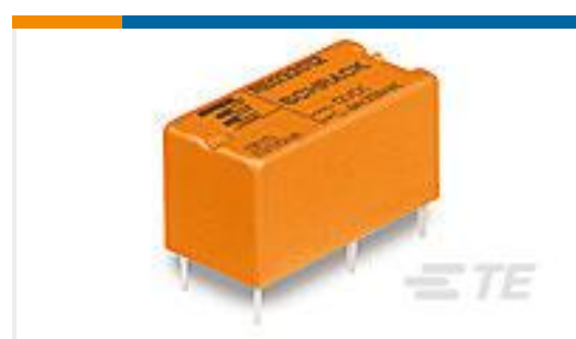
TE 产品编号1956226-2 RE035024