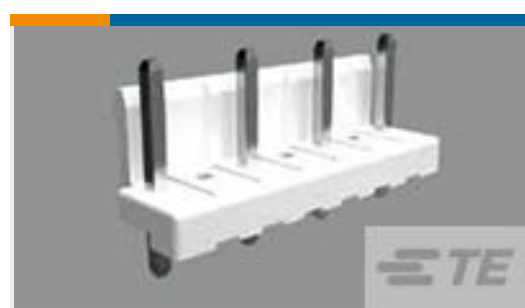
TE 产品编号1-1123724-3 3.96EP HDR ASSY 3(5)P NATURAL