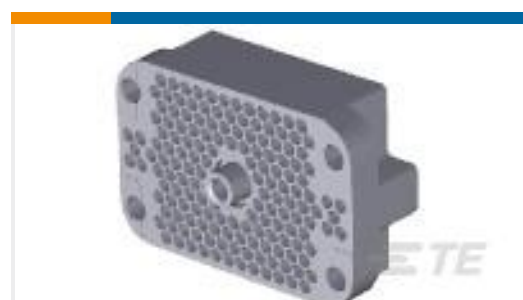
TE 产品编号202800-2 RECEPT ASSY,160 POS,M-SERIES