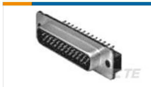
TE 产品编号5749892-1 50 PLUG ACT PIN/MS (IN,SPACER)