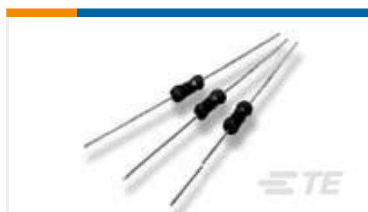
TE 产品编号1625893-9 5W SM M/OX 5% 100K