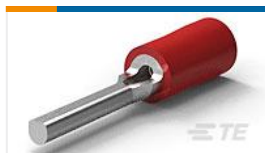
TE 产品编号165167-1 PG WIREPIN RED LONG