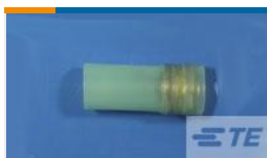
TE 产品编号588302N001 D-150-1004CS821