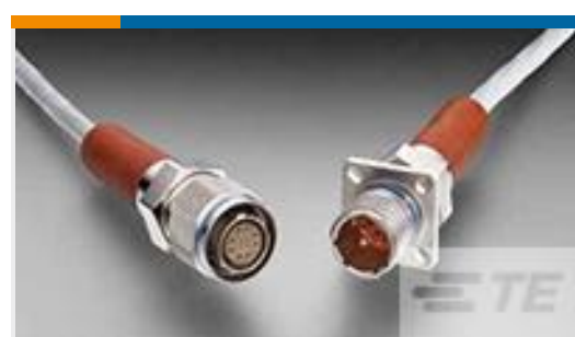
TE 产品编号YCFX26F1108SZN0000 PLUG ASSY