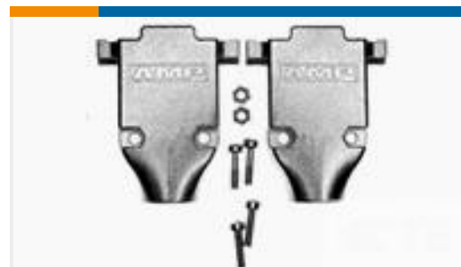
TE 产品编号5745171-2 SIZE 1 ASSY KIT .200