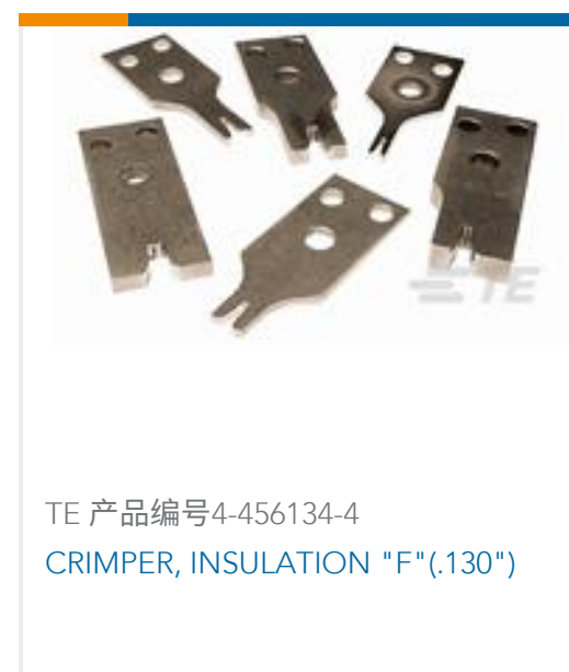
TE 产品编号4-456134-4 CRIMPER, INSULATION "F"(130")