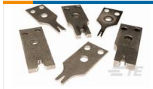
TE 产品编号1-456403-2 CRIMPER, WIRE .062 F