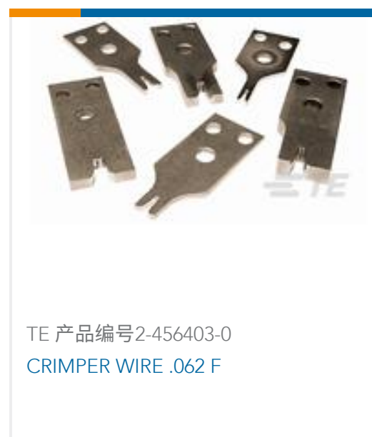
TE 产品编号2-456403-0 CRIMPER WIRE .062 F