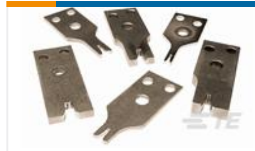
TE 产品编号2-456135-4 CRIMPER, INSULATION "O" (.120")