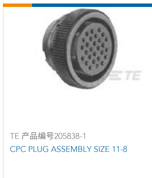
TE 产品编号205838-1 CPC PLUG ASSEMBLY SIZE 11-8