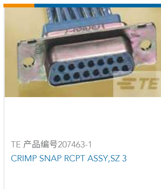
TE 产品编号207463-1 CRIMP SNAP RCPT ASSY,SZ 3