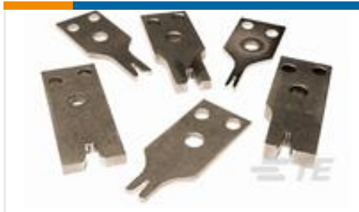
TE 产品编号4-456406-3 CRIMPER WIRE .090 "F"