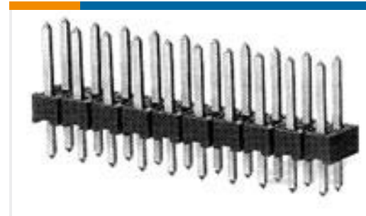
TE 产品编号6-146256-0 20 MODII HDR DRST B/A .100CL L