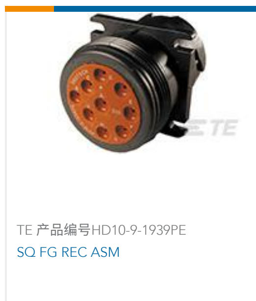
TE 产品编号HD10-9-1939PE SQ FG REC ASM