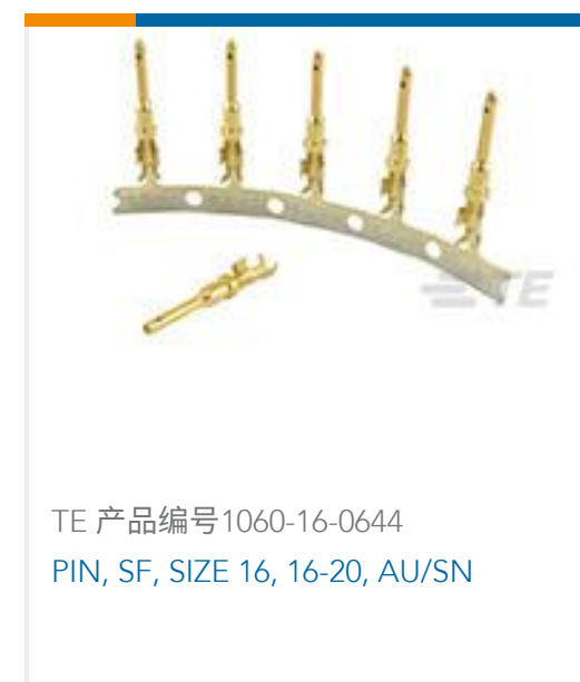
TE 产品编号1060-16-0644 PIN, SF, SIZE 16, 16-20, AU/SN