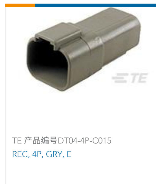
TE 产品编号DT04-4P-C015 REC, 4P, GRY, E