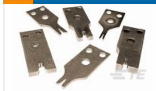
TE 产品编号7-456135-2 CRIMPER, INSULATION "O"(.155)