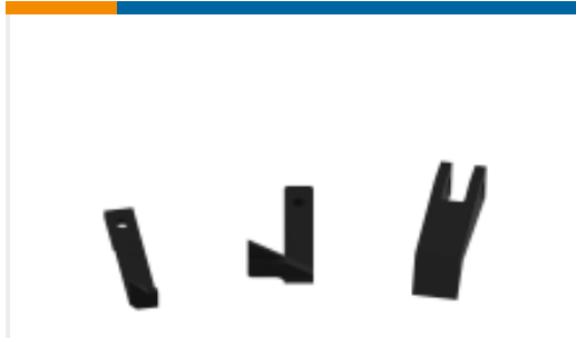
TE 产品编号458537-1 FEED PAWL