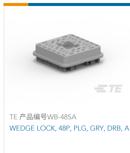
TE 产品编号WB-48SA WEDGE LOCK, 48P, PLG, GRY, DRB, A