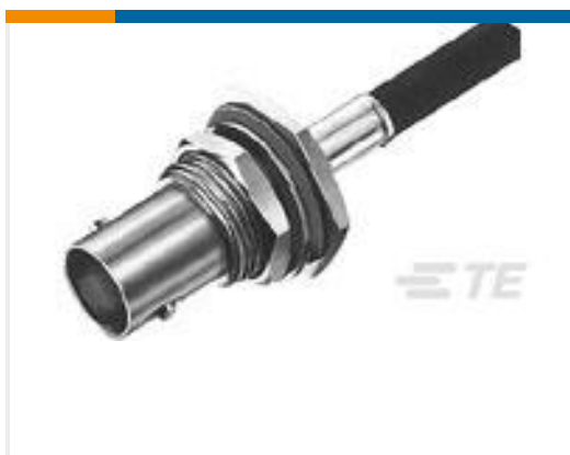
TE 产品编号5225398-6 CONNECTOR, BNC DUAL CRIMP JACK