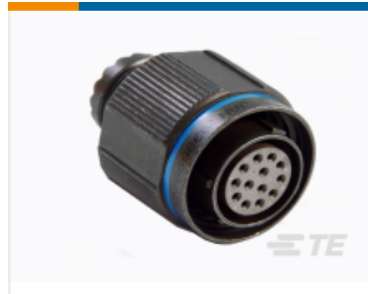
TE 产品编号YDTS26Z23-35PAV001 PLUG ASSY