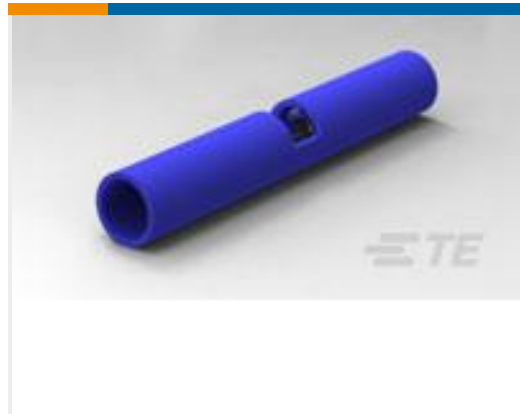
TE 产品编号8-320562-2 SPLICE BUTT PIDG 16-14