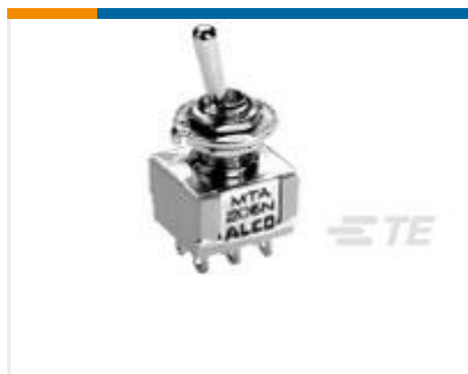
TE 产品编号7-1437558-5 MTE206R=(MSTE) SW TOG WATERPRO