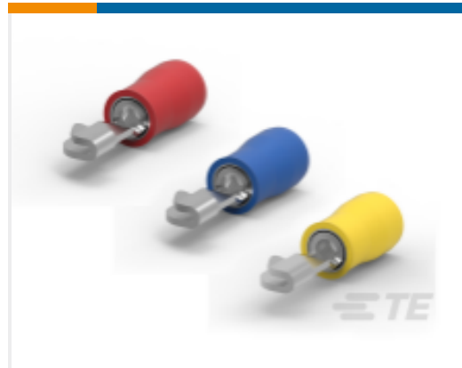
TE 产品编号8-32446-1 PIDG Knife Disconnect Splices