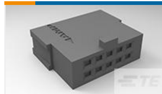
TE 产品编号487223-5 020 HOUSING FFC RCPT 100CL DR