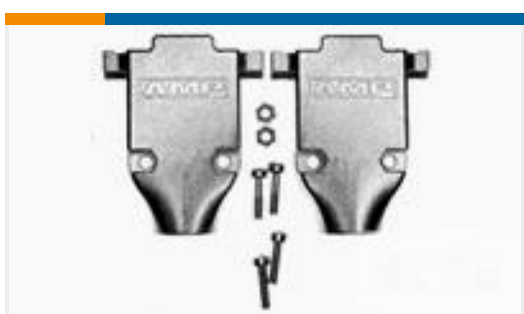
TE 产品编号5745175-5 CABLE CLAMP KIT,SZ 5