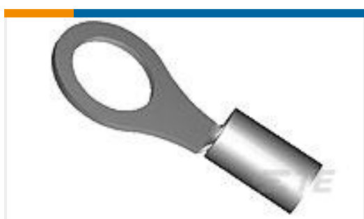
TE 产品编号320759 TERMINAL,SOLIS R 16-14HD 3/4