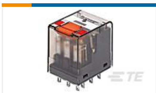
TE 产品编号6-1419111-8 PT370615