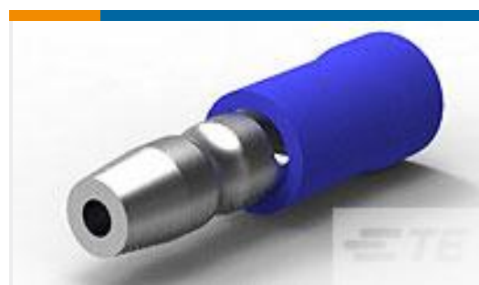
TE 产品编号324225 PLUG,SHUR PIDG 16-14