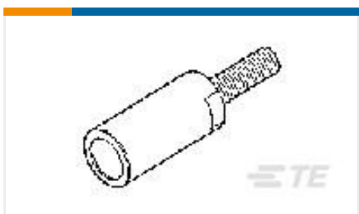
TE 产品编号192129-1 4MM 10B1S1/4-X 10-32