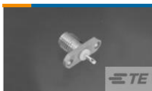
TE 产品编号1052928-1 2052 8003 92