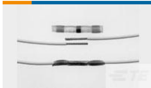
TE 产品编号D33598-000 B-152-9003