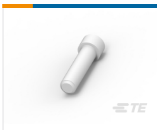
TE 产品编号114017-ZZ SEALING PLUG, SIZE 12/16, WHT