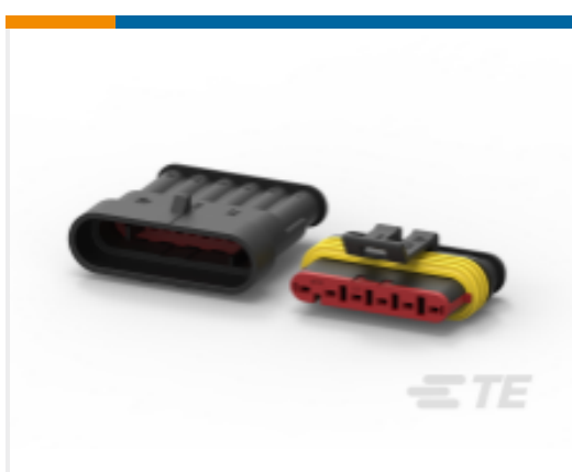
TE 产品编号282104-1 AMP SUPERSEAL 1.5MM, 连接器壳体