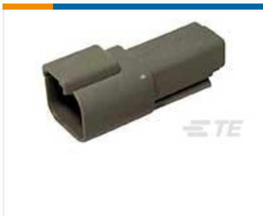
TE 产品编号DT04-2P REC, 2P, GRY, N