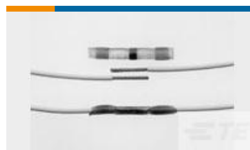
TE 产品编号D33598-000 B-152-9003