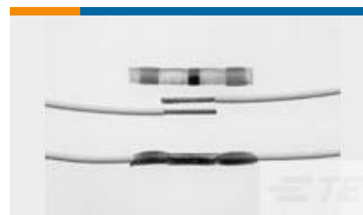
TE 产品编号F80600-000 B-152-9004