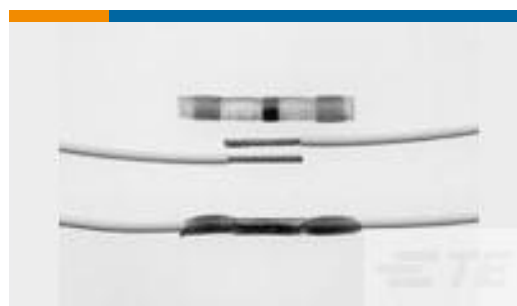
TE 产品编号D33598-000 B-152-9003