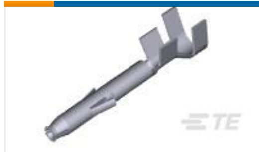
TE 产品编号1-794407-1 MINI UMNL SOK 20-16 AWG AU LF