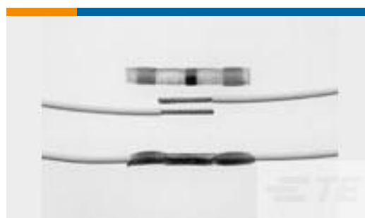
TE 产品编号D33598-000 B-152-9003