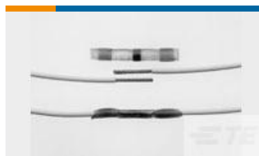
TE 产品编号F80600-000 B-152-9004