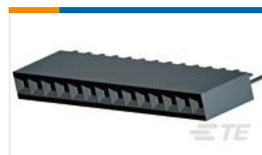
TE 产品编号1-535541-2 14 MODIV VRT SR CE 100/115