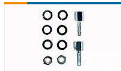
TE 产品编号5207719-1 KIT SCREWLOCK FEMALE