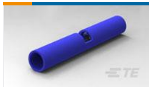
TE 产品编号320562 SPLICE BUTT PIDG 16-14