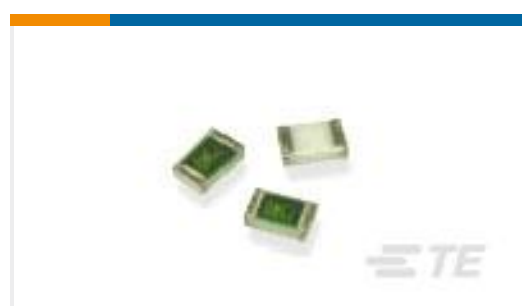
TE 产品编号4-1625868-1 RP 2A 0.25W 14R 0.1% 25PPM 1K RL