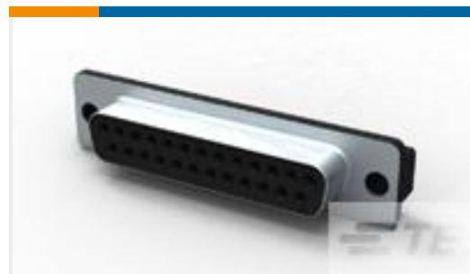
TE 产品编号5745967-2 25 RCPT SP/FMS STD