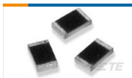
TE 产品编号1-1625865-4 RP 2A 4R99 0.1% 15PPM 1K RL