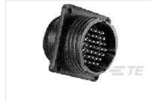
TE 产品编号206036-4 CPC RECPT SEALED SIZE 17-16