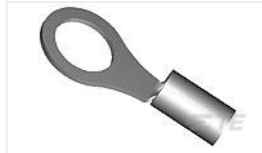
TE 产品编号1-321897-3 DG 22-16 HT ALUMEL R 8