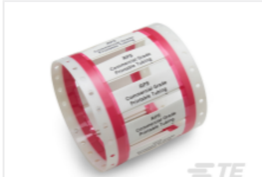
TE 产品编号CAT-T3437-R819 RPS Commercial Grade Sleeves