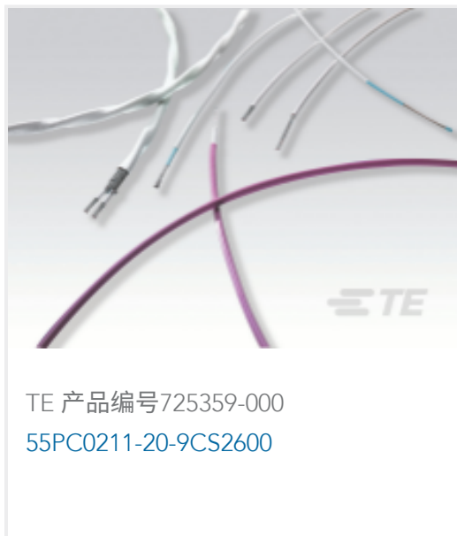
TE 产品编号725359-000 55PC0211-20-9CS2600