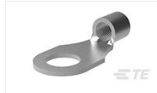
TE 产品编号34487 TERMINAL,SOLIS R 14-12 1/4