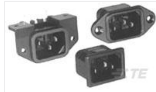
TE 产品编号1609133-1 6ESRF-3=F6988