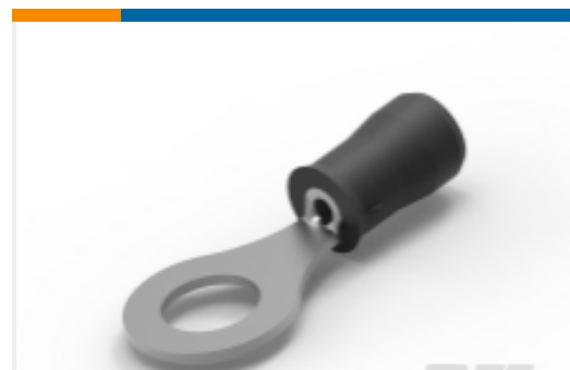
TE 产品编号2-35108-1 PIDG Ring Tongue Terminals