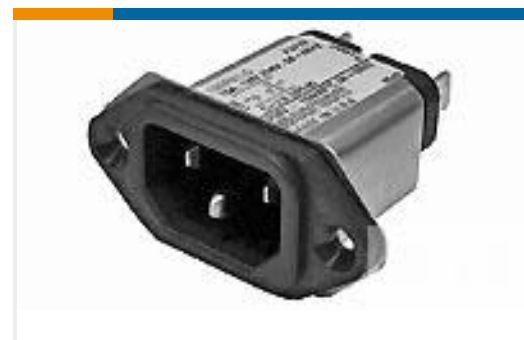
TE 产品编号6609987-9 15SRB1=F8219H