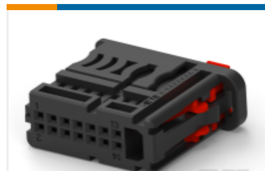
TE 产品编号2312114-1 14POS,NANOMQS,REC HSG ASSY, COD A