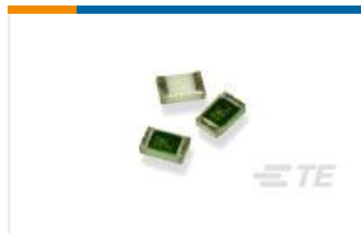
TE 产品编号6-1879061-2 CPF 0402 3K3 0.1% 25PPM 5K RL