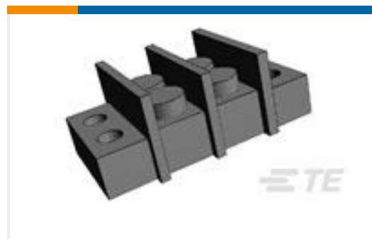
TE 产品编号1546306-2 2P .374" DR BARRIER STRIP