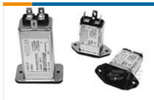
TE 产品编号6609007-3 20EEJ1=F7892A S0