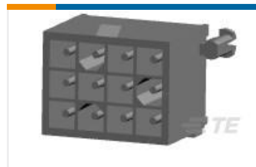
TE 产品编号1-770186-0 12P MINI-UMNL ASSY V0 SNNI*