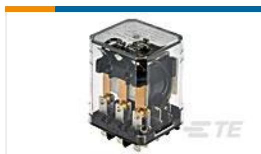
TE 产品编号7-1393117-9 KUP-14A15-24=KU