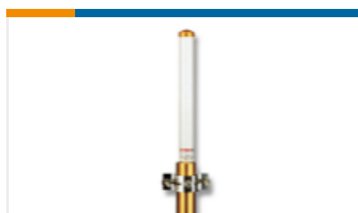
TE 产品编号FG9023 OMNI,FG,902-928MHZ 915MHz,3dBd