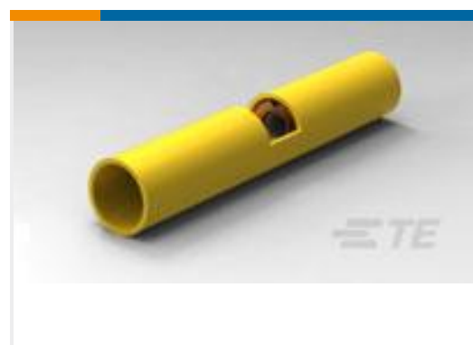
TE 产品编号320570 SPLICE BUTT PIDG 12-10