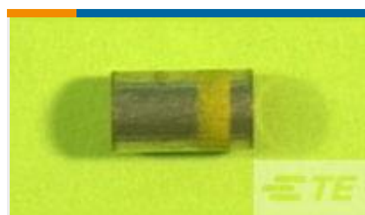
TE 产品编号680104-000 D-609-03