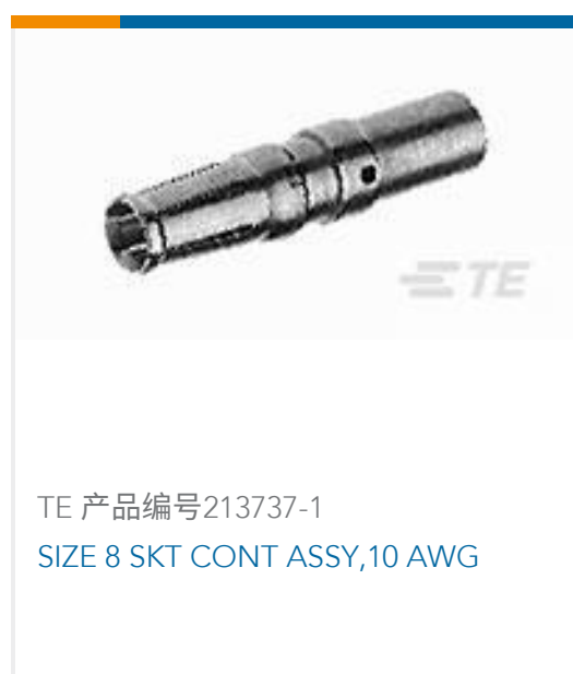
TE 产品编号213737-1 SIZE 8 SKT CONT ASSY,10 AWG