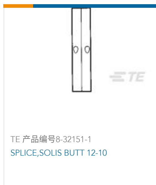
TE 产品编号8-32151-1 SPLICE,SOLIS BUTT 12-10