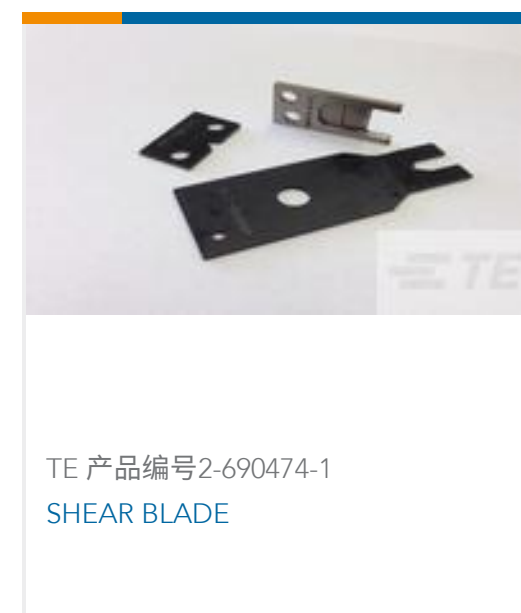
TE 产品编号2-690474-1 SHEAR BLADE