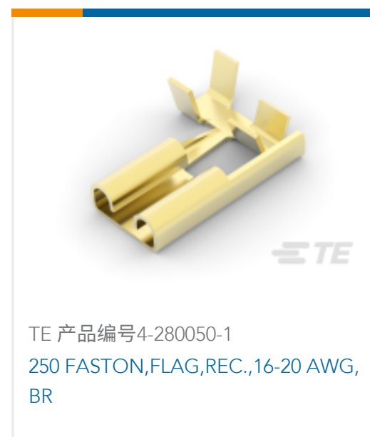
TE 产品编号4-280050-1 250 FASTON, FLAG, REC., 16-20 AWG, BR