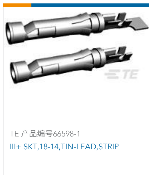
TE 产品编号66598-1 III+ SKT, 18-14, TIN-LEAD, STRIP