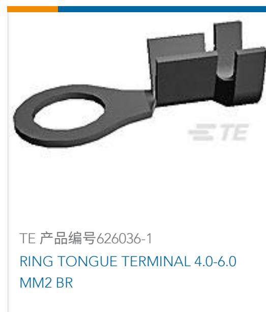
TE 产品编号626036-1 RING TONGUE TERMINAL 4.0-6.0 MM2 BR