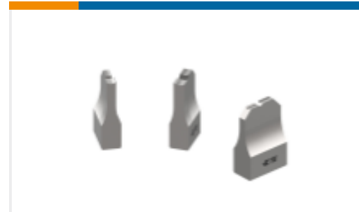
ANVIL REPRESENTATION ONLY TE 产品编号6-240693-0 ANVIL