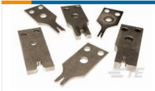
TE 产品编号2-690403-2 CRIMPER INSUL F