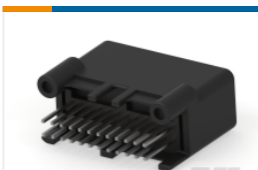
TE 产品编号1376111-6 025 24 POS CAP ASSY V