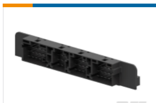
TE 产品编号1-1318384-4 High Pin Count Header