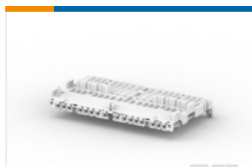
TE 产品编号1903883-1 0.50 SERIES CONN 16POS PLUG HOUSING ASSY