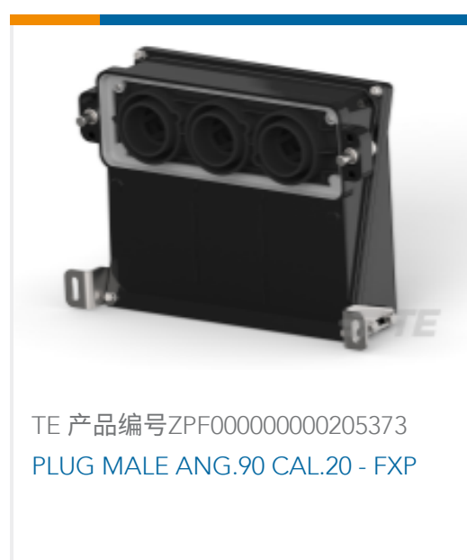
TE 产品编号ZPF000000000205373 PLUG MALE ANG.90 CAL.20 - FXP