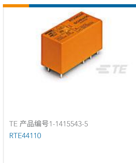
TE 产品编号1-1415543-5 RTE44110