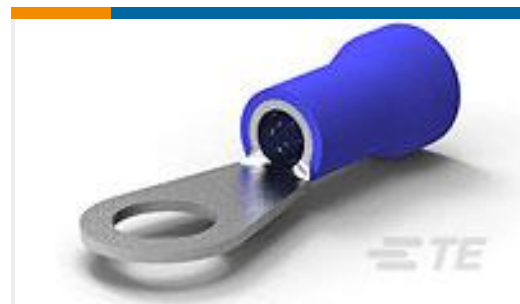
TE 产品编号52264-1 TERMINAL R PG 6 3/8