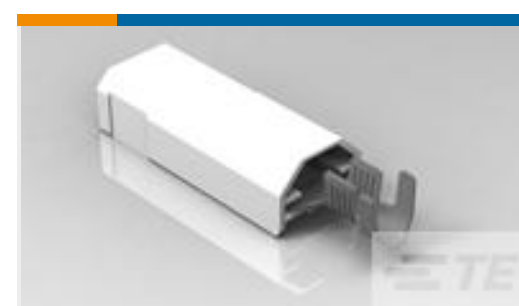
TE 产品编号521227-2 ULTRA-POD 250 ASSY TAB 12-10 AWG TPBR