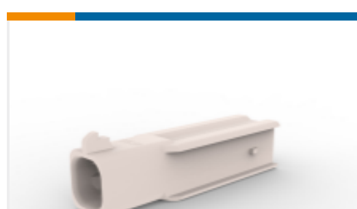
TE 产品编号1-2345729-1 Power Versa-Lock FH CAP, 1X1 KEY A