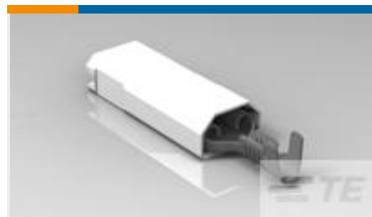
TE 产品编号520988-2 ULTRA-POD 250 ASSY REC 22-18 AWG TPBR