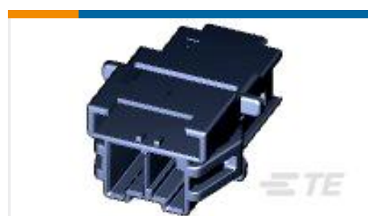
TE 产品编号1-2232263-1 PTL 1X2 CAP PANEL MT HOT WIRE KEY A BLK