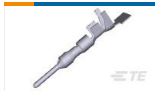
TE 产品编号1-794228-0 MINI UMNL2 PIN 22-18 AWG AU LP