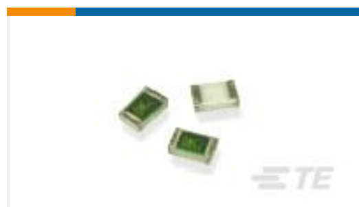
TE 产品编号6-2176092-2 RP 2A 0.25W 3K32 0.1% 25PPM 1K RL