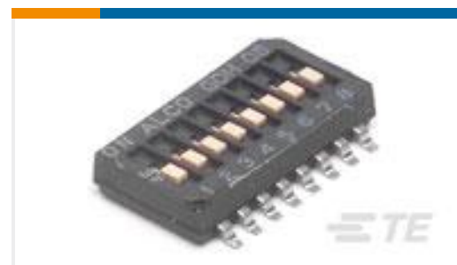
TE 产品编号1-1571983-0 GDH08S04=DIP SWITCH