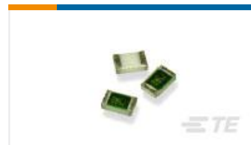
TE 产品编号9-1614884-3 CPF 0805 30K 0.1% 25PPM 1K RL