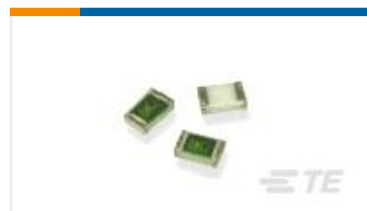
TE 产品编号1-2176093-5 RP 2A 0.25W 13K3 0.1% 25PPM 1K RL