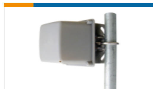
TE 产品编号MD24-12 Dir,Mini,Fixed,NF 2400-2485MHz, 11dBi,BW6