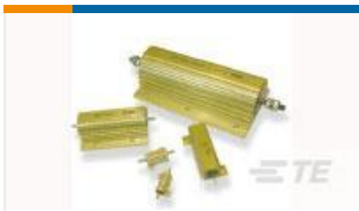
TE 产品编号9-1625971-5 HSA25 R01 10%