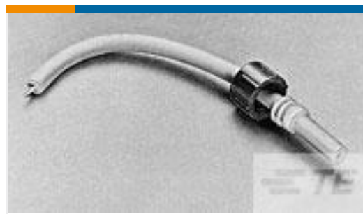
TE 产品编号1-830611-0 LGH 1/2 SNGL MLD END