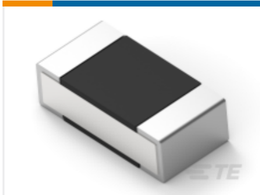
TE 产品编号3-2176307-2 RP 1E 0.1W 26K1 0.1% 25PPM 5K RL