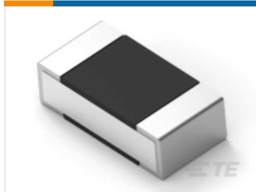
TE 产品编号7-2176305-3 RP 1E 0.1W 604R 0.1% 25PPM 5K RL