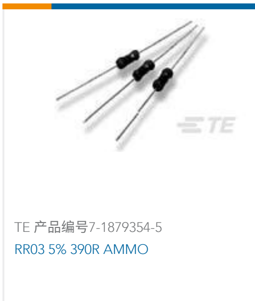
TE 产品编号7-1879354-5 RR03 5% 390R AMMO