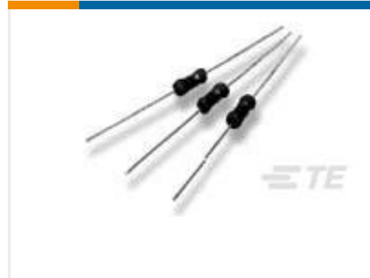
TE 产品编号1-1879353-9 RR02 5% 24K AMMO