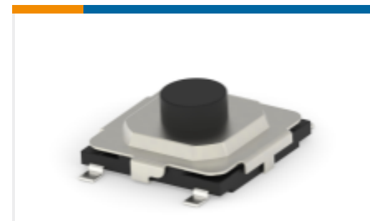
TE 产品编号2337238-3 TACT MINI GW 5.2X5.2X2 160GF