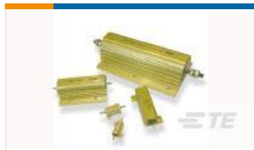
TE 产品编号9-1625971-5 HSA25 R01 10%