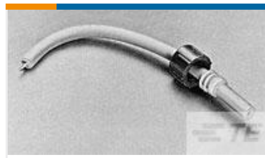
TE 产品编号1-830611-0 LGH 1/2 SNGL MLD END