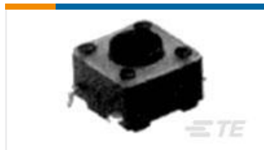
TE 零件编号2-1437565-7 FSM2JSMA=SMT,TACTILE, PB SWITCH