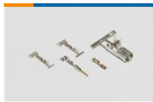
线对板连接器端子(4)