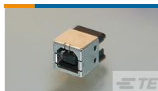
TE 零件编号1734346-1 STD USB TYPE B, R/A, SMT