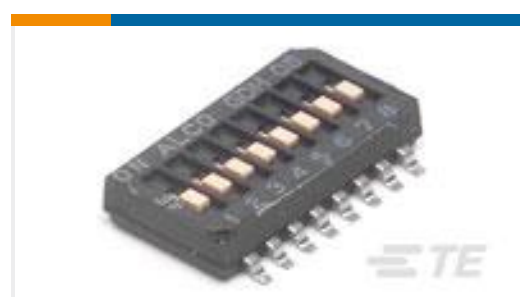
TE 零件编号1571983-4 GDH04S04=DIP SWITCH