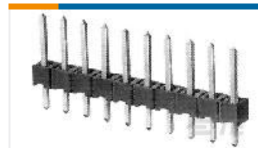
TE 零件编号826629-2 2P AMPMODU II