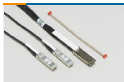
插拔式 I/O 电缆部件(54)