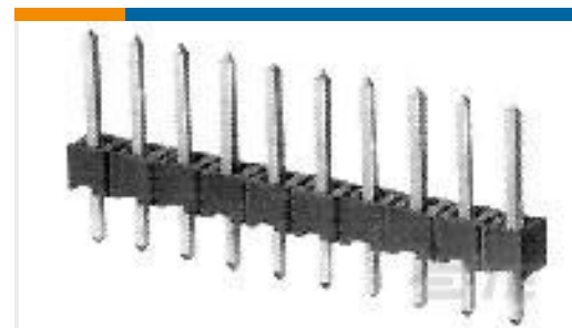
TE 零件编号825433-2 MOD 2 PINHDR 1X2 P.