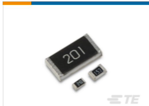
TE 产品编号5-2176327-6 CRGP 0805 390K 1%