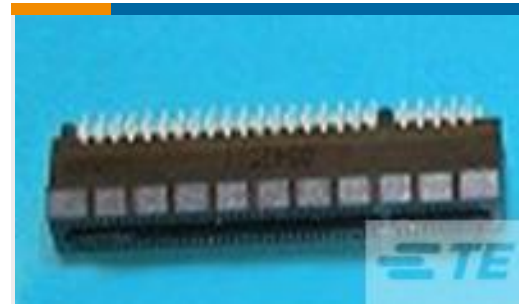
TE 产品编号5645235-3 CONN SEC II 50 POS 100C/L