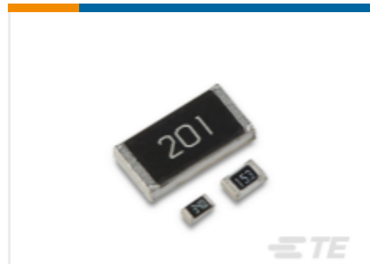
TE 产品编号5-2176327-7 CRGP 0805 470K 1%