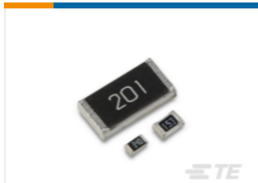
TE 产品编号2-2176327-7 CRGP 0805 1K5 1%