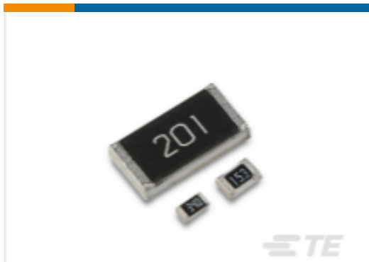
TE 产品编号4-2176327-9 CRGP 0805 100K 1%