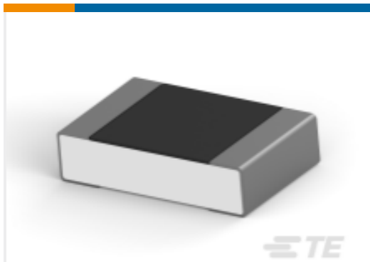
TE 产品编号1-2176382-9 RQ 0805 205K 0.1% 10PPM 5K RL