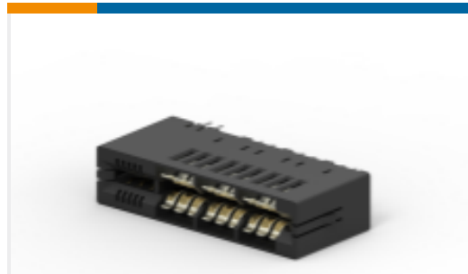
TE 产品编号2204072-1 MULTI-BEAM CE 2X3 P + 2X5 S VERTICAL