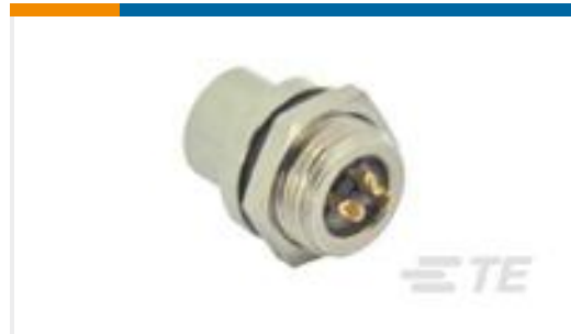
TE 产品编号1838417-2 M12 Mtl FEMALE PNL CONN. PCB Front (Hex)