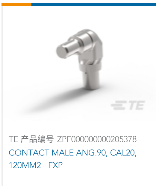
TE 产品编号 ZPF000000000205378 CONTACT MALE ANG.90, CAL20, 120MM2 - FXP