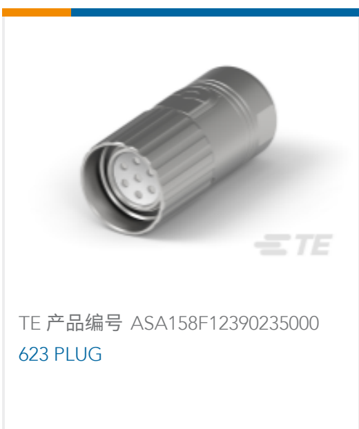
TE 产品编号 ASA158F12390235000 623 PLUG