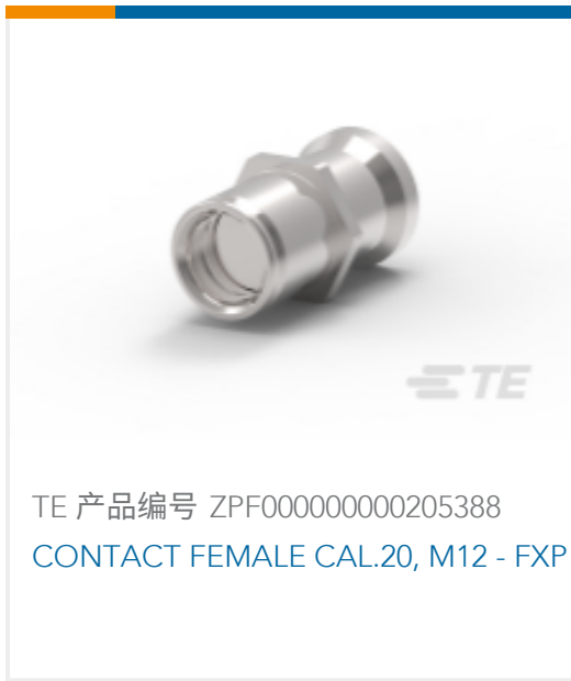
TE 产品编号 ZPF000000000205388 CONTACT FEMALE CAL.20, M12 - FXP