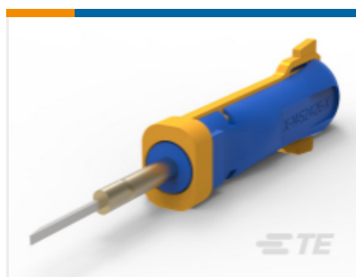
TE 产品编号 1452426-1 EXTRACTION TOOL