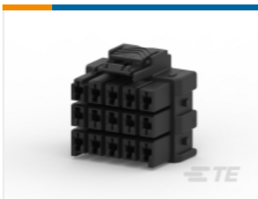
TE 产品编号 1-2232357-5 PTL 3X5 PLUG HSG HOT WIRE KEY A BLK