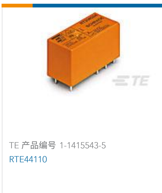
TE 产品编号 1-1415543-5 RTE44110