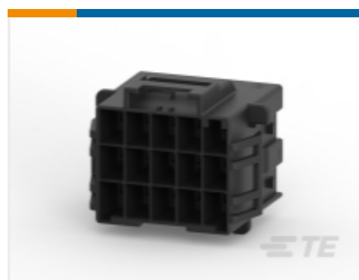
TE 产品编号 1-2232356-5 PTL 3X5 CAP PANEL MT HOT WIRE KEY A BLK