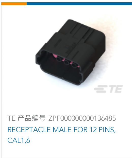
TE 产品编号 ZPF000000000136485 RECEPTACLE MALE FOR 12 PINS, CAL1,6