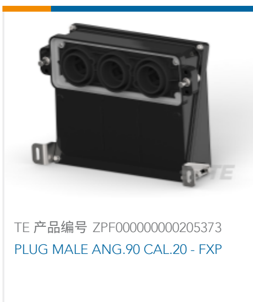
TE 产品编号 ZPF000000000205373 PLUG MALE ANG.90 CAL.20 - FXP