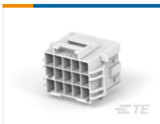
TE 产品编号 8-1971875-7 PTL 3X5 CAP PANEL MT HITEMP KEY D NAT