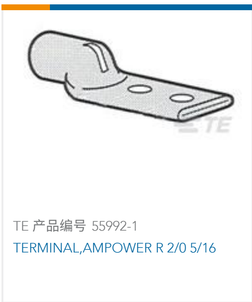
TE 产品编号 55992-1 TERMINAL, AMPPOWER R 2/0 5/16