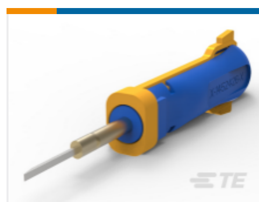
TE 产品编号 1452426-1 EXTRACTION TOOL