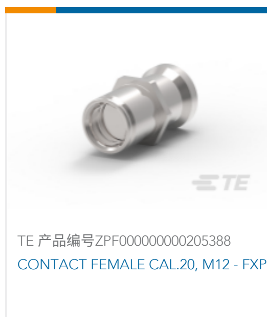
TE 产品编号ZPF000000000205388 CONTACT FEMALE CAL.20, M12 - FXP