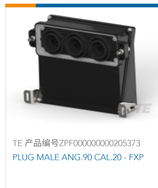
TE 产品编号ZPF000000000205373 PLUG MALE ANG.90 CAL.20 - FXP