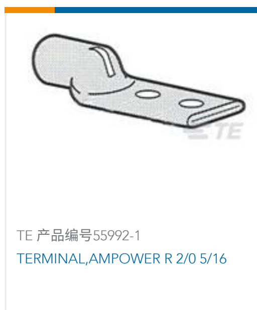
TE 产品编号55992-1 TERMINAL,AMPOWER R 2/0 5/16