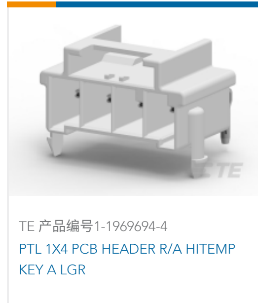
TE 产品编号1-1969694-4 PTL 1X4 PCB HEADER R/A HITEMP KEY A LGR