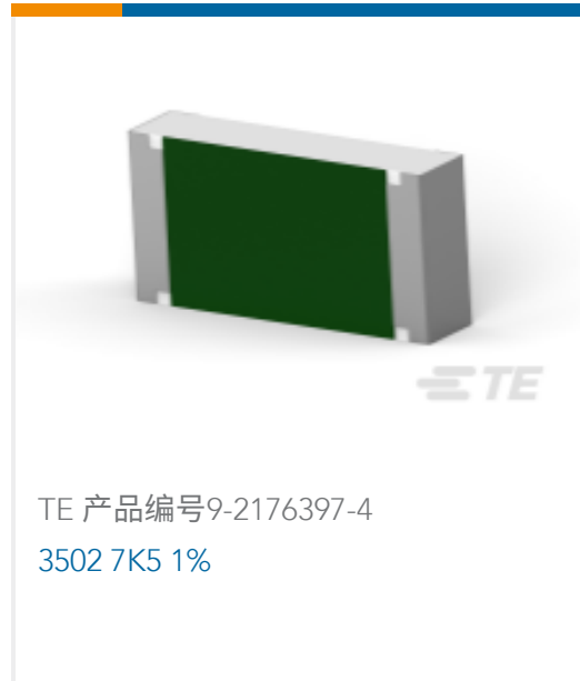
TE 产品编号9-2176397-4 3502 7K5 1%