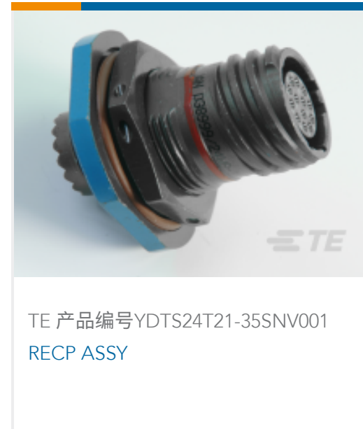
TE 产品编号YDTS24T21-35SNV001 RECP ASSY