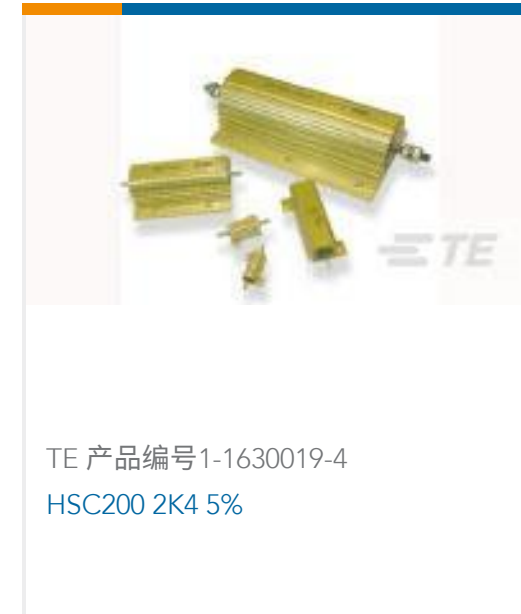
TE 产品编号1-1630019-4 HSC200 2K4 5%