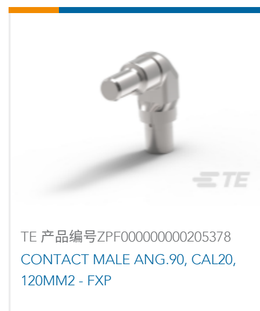
TE 产品编号ZPF000000000205378 CONTACT MALE ANG.90, CAL20, 120MM2 - FXP