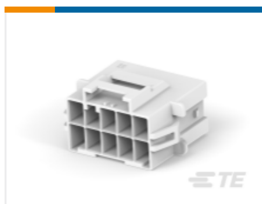
TE 产品编号 8-1971775-5 PTL 2X5 CAP PANEL MT HIGH TEMP KEY D NAT