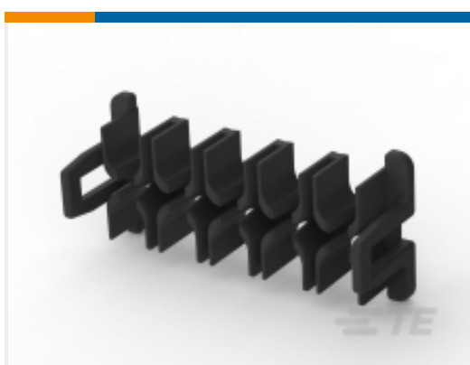
TE 产品编号 1971778-5 PTL TPA HIGH TEMP 2 x 5 BLACK