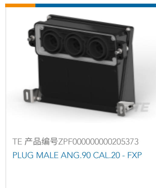
TE 产品编号ZPF000000000205373 PLUG MALE ANG.90 CAL.20 - FXP