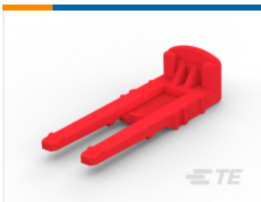
TE 产品编号 1971789-1 CPA