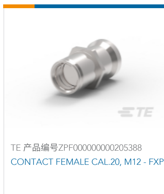
TE 产品编号ZPF000000000205388 CONTACT FEMALE CAL.20, M12 - FXP