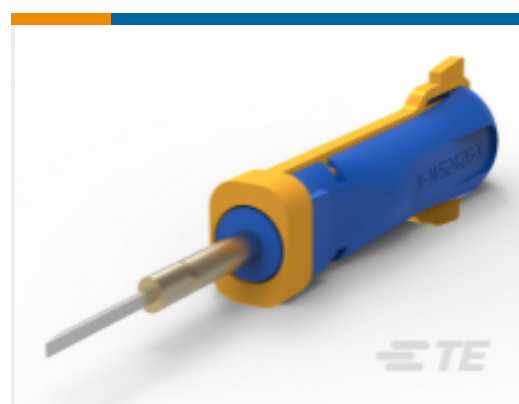
TE 产品编号 1452426-1 EXTRACTION TOOL