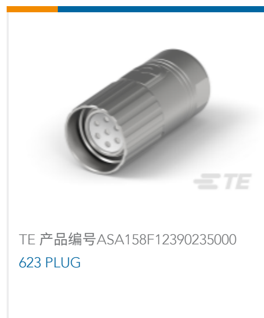
TE 产品编号ASA158F12390235000 623 PLUG