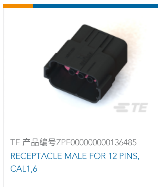
TE 产品编号ZPF000000000136485 RECEPTACLE MALE FOR 12 PINS, CAL1,6