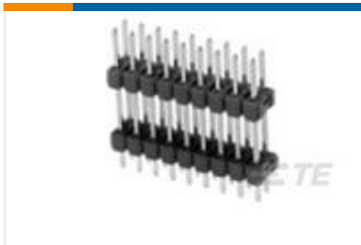
TE 产品编号5-146496-2 04 MODII HDR DRST UNSHRD STKG