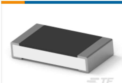
TE 产品编号1-2176391-0 RQ 1206 15K4 0.1% 10PPM 5K RL